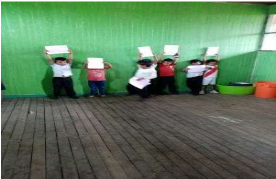
Niños mostrando los trabajos realizados