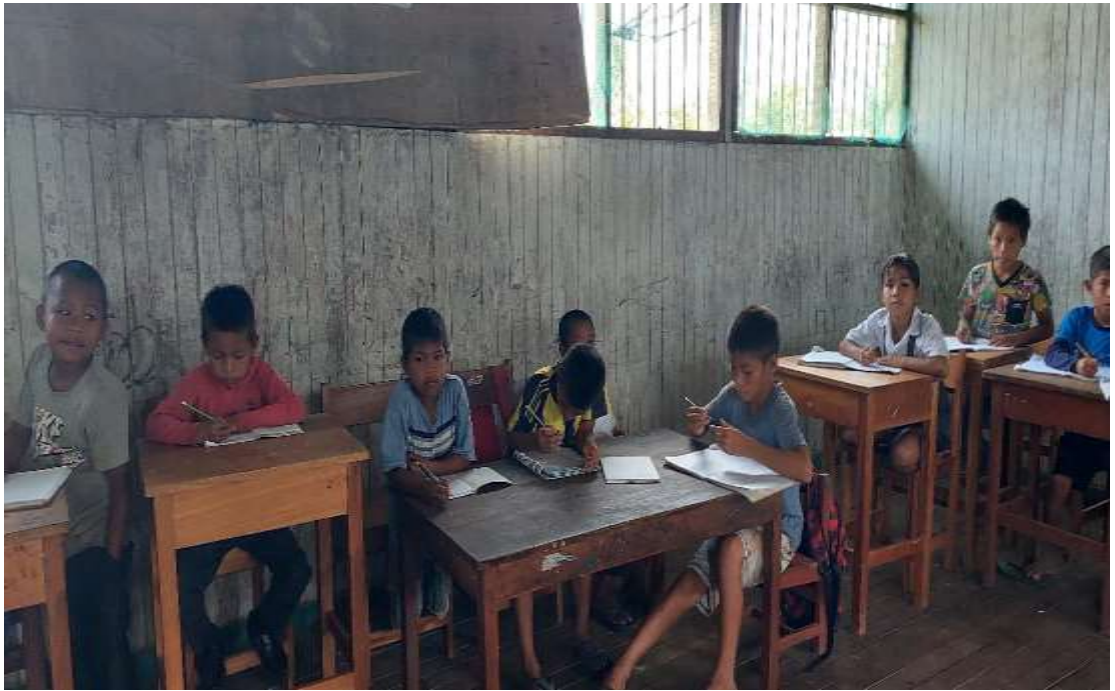
Niños desarrollando la actividad planteada por el docente