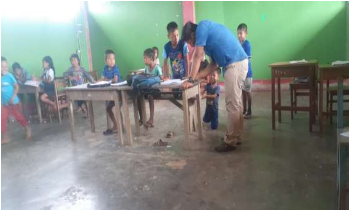
Evaluando los logros alcanzados de manera individual