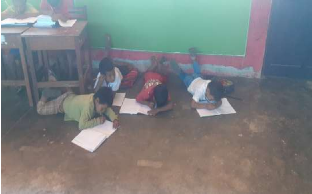
Niños escribiendo sus cuentos tradicionales