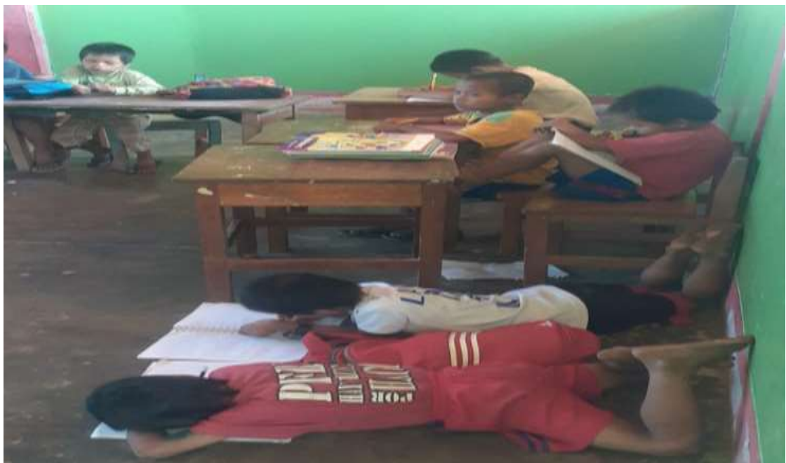
Niños desarrollando sus actividades según su cultura