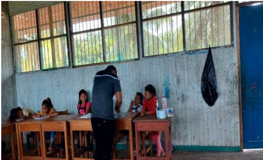
Evaluando el trabajo que los niños han realizado